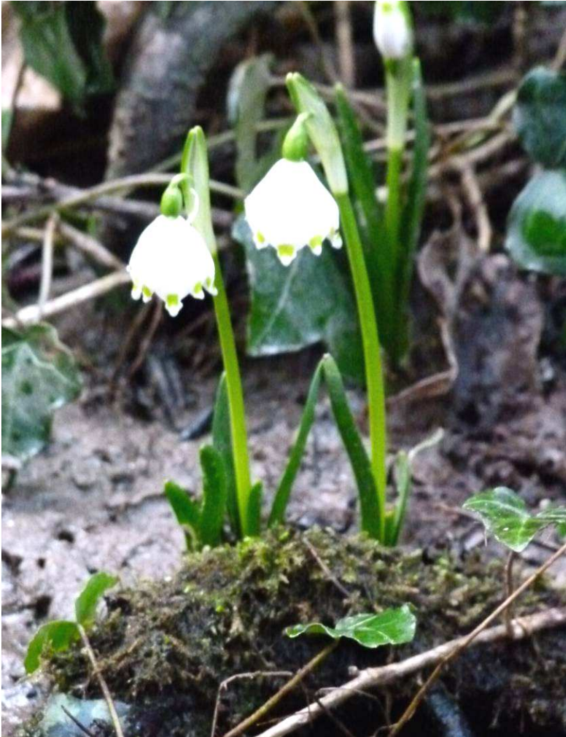
Frühlingstal / valle della primavera