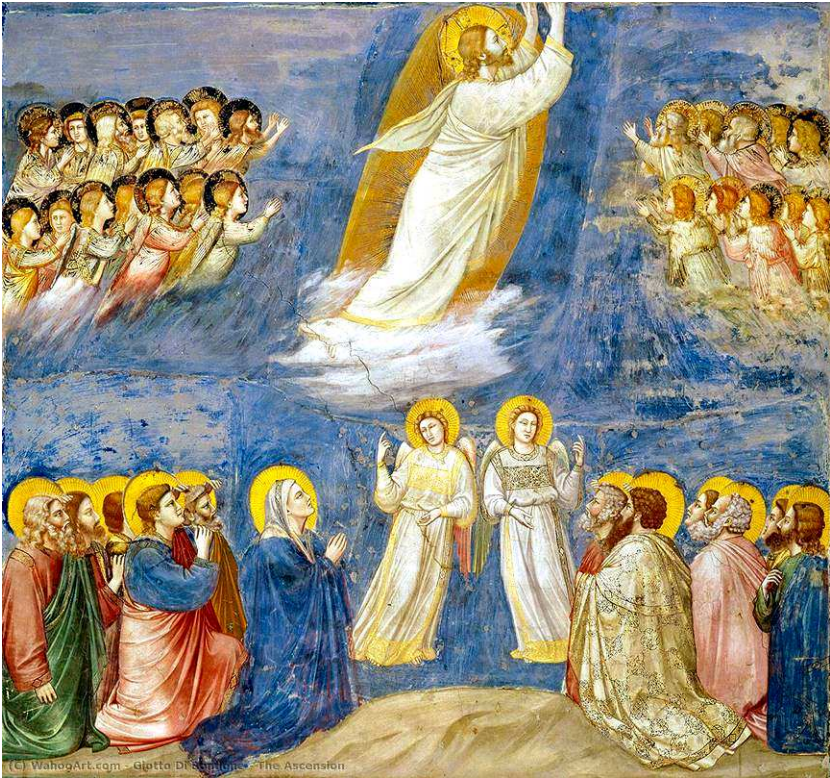
Giotto di Bondone - Fresko 1305

Halleluja - Halleluja Geht und macht alle Völker zu meinen Jüngern. Ich bin mit euch alle Tage bis zum Ende der Welt.